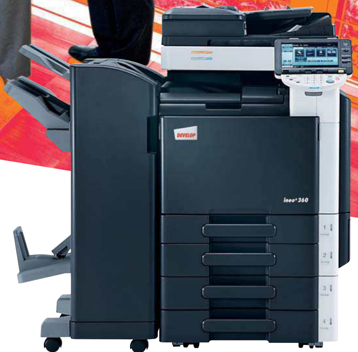
ineo+ 360 mit Originaleinzug (DF-617), Standfinisher (FS-527), Rücksticheinheit (SD-509) und 2 x 500 Blatt Papierkassette (PC-207)