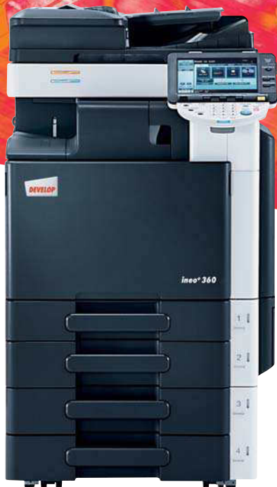
ineo+ 360 mit Originaleinzug (DF-617), Integriertem Finisher (FS-529) und 2 x 500 Blatt Papierkassette (PC-207)